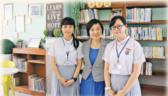
▲教育局副局長蔡若蓮（中）親臨學校，肯定了學校推動閱讀的努力，讚賞學生文質彬彬，更感受文藝之風遍布校園。

也能享受閱讀的樂趣。教師為讓學生跳出狹隘的視野，在周會上分享各地書店的人文景色，甚至找機會和學生親自走一趟，豐富學生的閱歷。同時，學校亦每周推出「有聲好書」廣播節目，用聲音導航，為學生全方位享受閱讀。