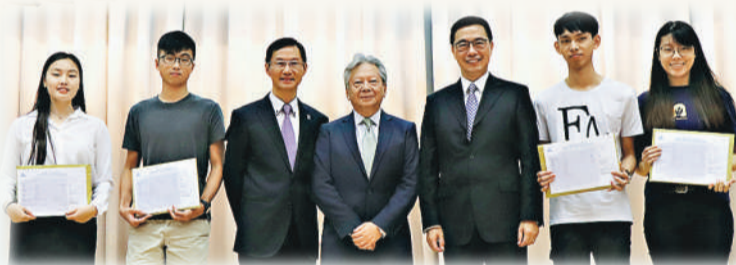
▲教育局局長楊潤雄（左三）於文憑試放榜日親臨學校，為中六學生打氣。

除了課堂和學術成就，教師同樣關懷學生的成長，讓學生建立積極正面的價值觀和態度。學生亦態度親切、尊師重道、關心同儕，表現知規守禮，展現